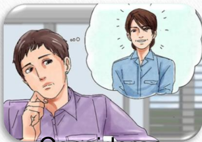
Consideran la audiencia