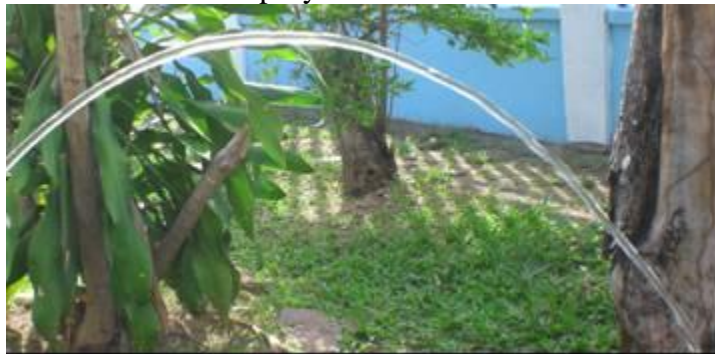
Figura 1. Agua saliendo de una manguera

La figura 1 muestra la trayectoria curva del agua que sale de una manguera. Todos hemos visto como varía el punto donde cae el agua, dependiendo de la presión con que es empujada. Este movimiento también lo vemos en los deportes, donde la pelota efectúa con mucha frecuencia movimientos parabólicos. El agua arrojada por una manguera es un ejemplo de movimiento de proyectiles