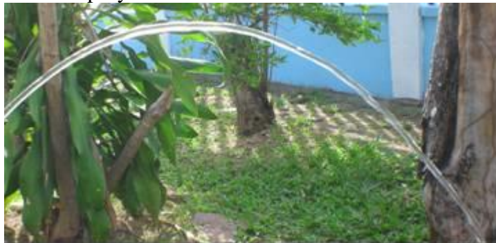
Figura 1. Agua saliendo de una manguera

La figura 1 muestra la trayectoria curva del agua que sale de una manguera. Todos hemos visto como varía el punto donde cae el agua, dependiendo de la presión con que es empujada. Este movimiento también lo vemos en los deportes, donde la pelota efectúa con mucha frecuencia movimientos parabólicos. El agua arrojada por una manguera es un ejemplo de movimiento de proyectiles